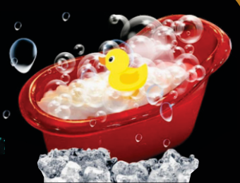
ÊXTASE TROPICAL R$ 40,00

Gin, licor de maracujá, soda, raspas de limão, espuma de limão siciliano