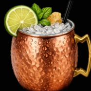
MOSCOW MULE R$ 40,00

Vodka, xarope de gengibre, tônica, suco de limão, finalizada com espuma de gengibre