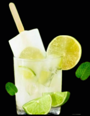
CAIPIRINHA LAS VEGAS R$ 35,00

Vodka, xarope de gengibre, tônica, suco de limão, finalizada com espuma de gengibre