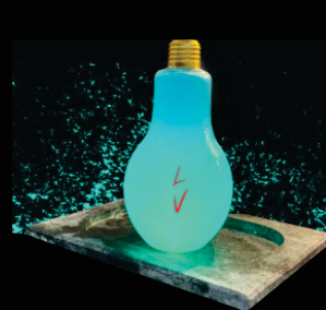
LÂMPADA MÁGICA R$ 40,00